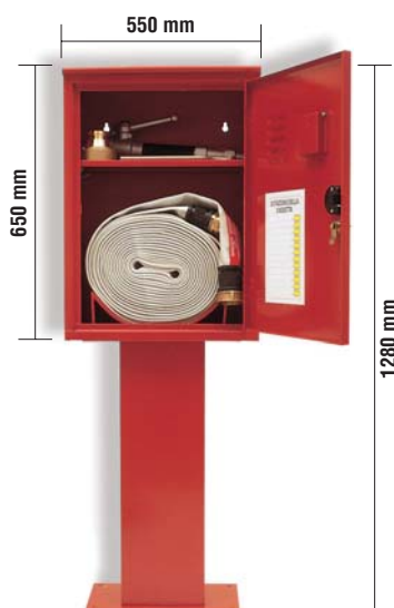
Profondità 320 mm