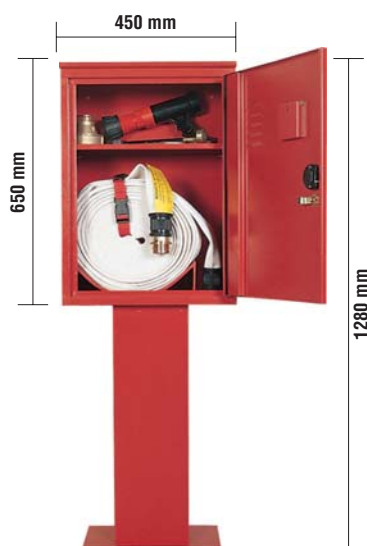
Profondità 250 mm

Cassette in acciaio zincato verniciato rosso RAL 3000 con resine poliesteri speciali per esterni ad elevata resistenza alla corrosione (ISO 9227) con configurazione antinfortunistica complete di serratura con 2 chiavi e lastra frangibile trasparente a rottura di sicurezza. Fornita di sella salvamanichetta e di un ripiano regolabile in altezza per l'alloggiamento delle attrezzature a corredo degli idranti.