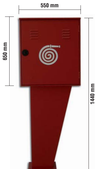
Profondità 260 mm

Cassette in acciaio zincato verniciato rosso RAL 3000 con resine poliesteri speciali per esterni ad elevata resistenza alla corrosione (ISO 9227) con configurazione antinfortunistica complete di serratura con 2 chiavi e lastra frangibile trasparente a rottura di sicurezza. Fornita di sella salvamanichetta e due sigilli.