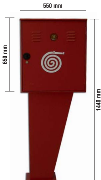
Profondità 260 mm