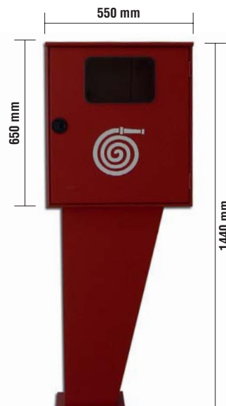
Profondità 260 mm