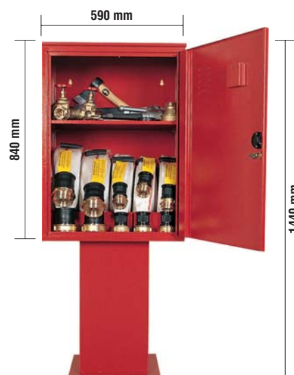
Profondità 460 mm