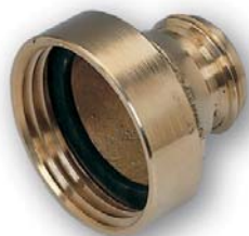
RIDUZIONI FISSE MASCHIO - FEMMINA