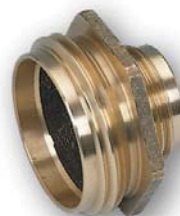
RIDUZIONI FISSE MASCHIO - MASCHIO