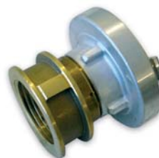
RIDUZIONI MISTE UNI OTTONE - STORZ ALLUMINIO