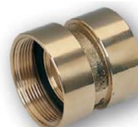
RIDUZIONI FISSE FEMMINA - FEMMINA