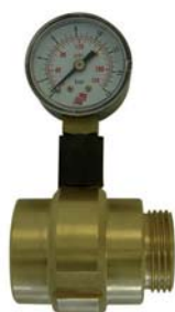
GIUNTO CON VALVOLA DI RITEGNO E MANOMETRO